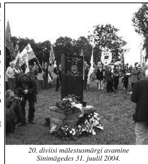
20. diviisi mälestusmärgi avamine Sinimägedes 31. juulil 2004.

leegionid) erinesid täielikult Saksa SS-ist nii otstarbe, ideoloogia, tegutsemise kui liikmete kvalifikatsiooni poolest, mistõttu Komisjon otsustas, et vastavalt Ameerika Ühendriikide "Ümberasustavate isikute Ameerika Ühendriikidesse asumise seaduse" paragrahv 13 alusel, ei ole need organisatsioonid vaenuliku Ameerika Ühendriikide valitsusele, mistõttu nende isikute avaldused, kes soovivad asuda Ameerika Ühendriikidesse elama "Ümberasustavate isikute Ameerika Ühendriikidesse asumise seaduse" alusel ja kes on olnud Balti Waffen-SS liikmed, kaasa arvatud Eesti Leegion, vaadatakse läbi iga isiku puhul individuaalselt.