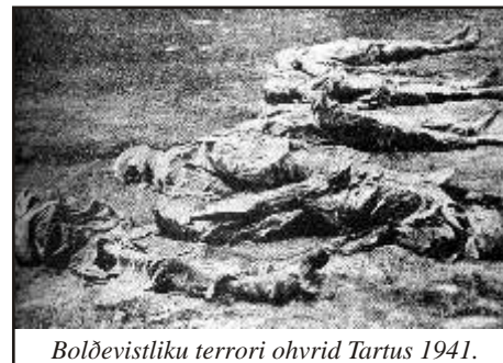
Bolševistliku terrori ohvrid Tartus 1941.