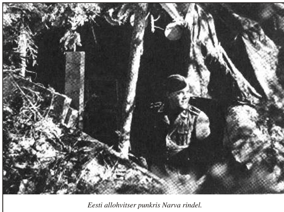
Eesti allohvitser punkris Narva rindel.

Taganevate Saksa väeosade kolonnid jõudsid Narva 20.jaanuaril ja nende pidev liikumine üle Narva jõe kestis kuni 2.veebruari. Need polnud enam diviisid ega rügemendid, vaid vormitu inimmass, kes jättis maha relvi ja varustust. Selles olukorras otsustas Saksa väejuhatas Eesti