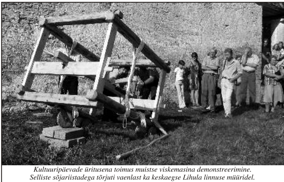
Kultuuripäevade üritusena toimus muistse viskemasina demonstreerimine. Selliste sõjariistadega tõrjuti vaenlast ka keskaegse Lihula linnuse müüridel.