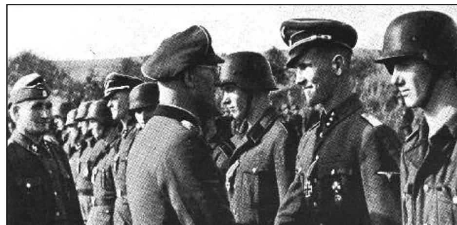
Pataljon Narva ohvitseride ja sõdurite autasustamine lahingulise kangelaslikuse eest.

ka Eesti Omakaitse puudulikult relvastatud üksused ning mitmed eestlaste piirivalvepataljonid. Kuigi Narva rindelt saadeti appi veel väeosi, olid jõud väga ebavõrdsed.