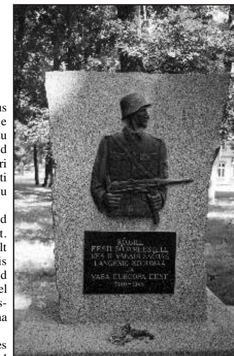
Selline nägi välja ausammas Pärnus 2002, nüüdseks on muudetud tekst

suurt sümbolset jõudu. Need kannavad endas väärtusi, toetavad ühiseid identiteete, legitimeerivad võimu ja ajalookäsitlust. Õigus püstitada monumente- või neid muuta- on sellel, kelle käes on võim," kirjutab Eesti Päevalehe juhtkirj 13.augustil. Tallinna kesklinnas seisab "vabastajate" mundris pronksmees, mille juures venekeelsed sõjaveteranid 9.mail "viina viskavad". Samalaadsed monumendid seisavad püsti paljudes Eesti linnades. Aga kui Lihula vallavalitsus tahab püsti panna eesti sõdurite ausamba, puhkeb võimupoliitikute seas hüsteeria.