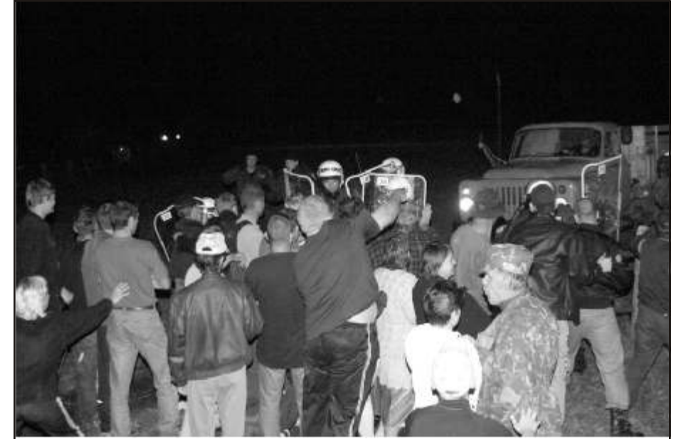
Eesti Vabariigi valitsuse jõuvõtet Lihula elanike kallal 2 septembril 2004.

Venelane tuli 1944.aastal uuesti Eestisse, et meid tappa ja küüditada. See ON ajalugu. Miks Lihula actioni organiseerijad neid asju maailmale ÕIGESTI ei seleta, on küsimus. Nende samade meeste-naiste vanemad (ja ka nad ise) on harjunud käske täitma. Nii, nagu üle poole sajandi tagasi kahel korral. Koostasid nimekirjad, tellisid loomavagunid, korraldasid venelaste kaasabil "äravedu", varastasid eesti rahva vara, majapidamised, loomad. Tegid meid