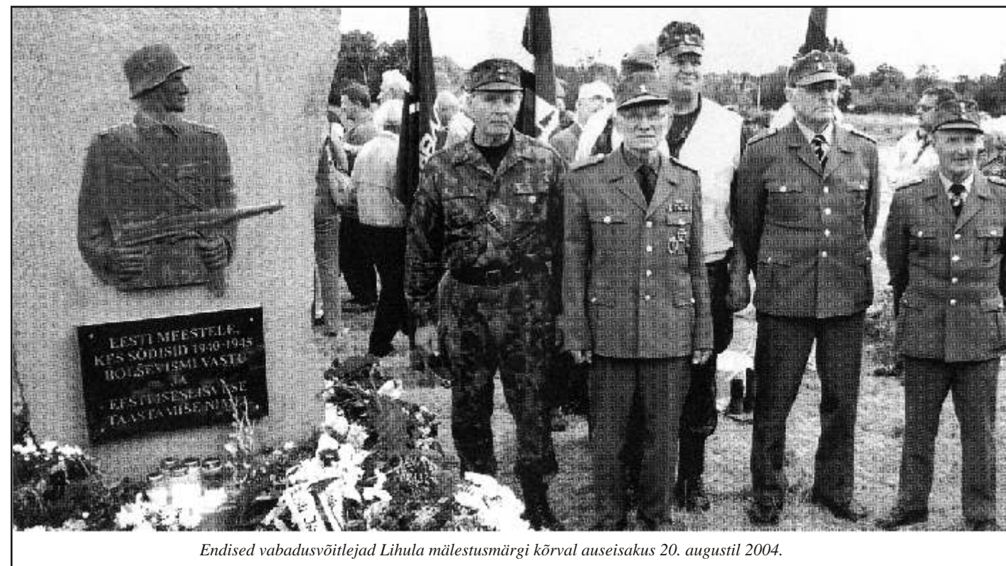
Endised vabadusvõitlejad Lihula mälestusmärgi kõrval ausesikus 20. augustil 2004.

Nüüd on ajaloovõltsijad välja tulnud väitega, et Uluotsa kuulutatud mobilisatsioon olevat olnud asjatu eestlaste tapmine. Samal ajal needsamad akadeemilise kraadiga ajaloovõltsijad vaikivad maha 1941. aasta mobilisatsiooniga Venemaale viidud ja töölaagrites surmuskäljutatud eestlased. Millega nende meeste naljasurm ja ellujäänute võitlus Eesti Korpuses Eestimaa taasvõllutamisel, vennatapulahingutes Narva all, Avinurmes, Porkunis, Emajõe rindel, Tehumardil, Kuramaal, oli õigustatud?