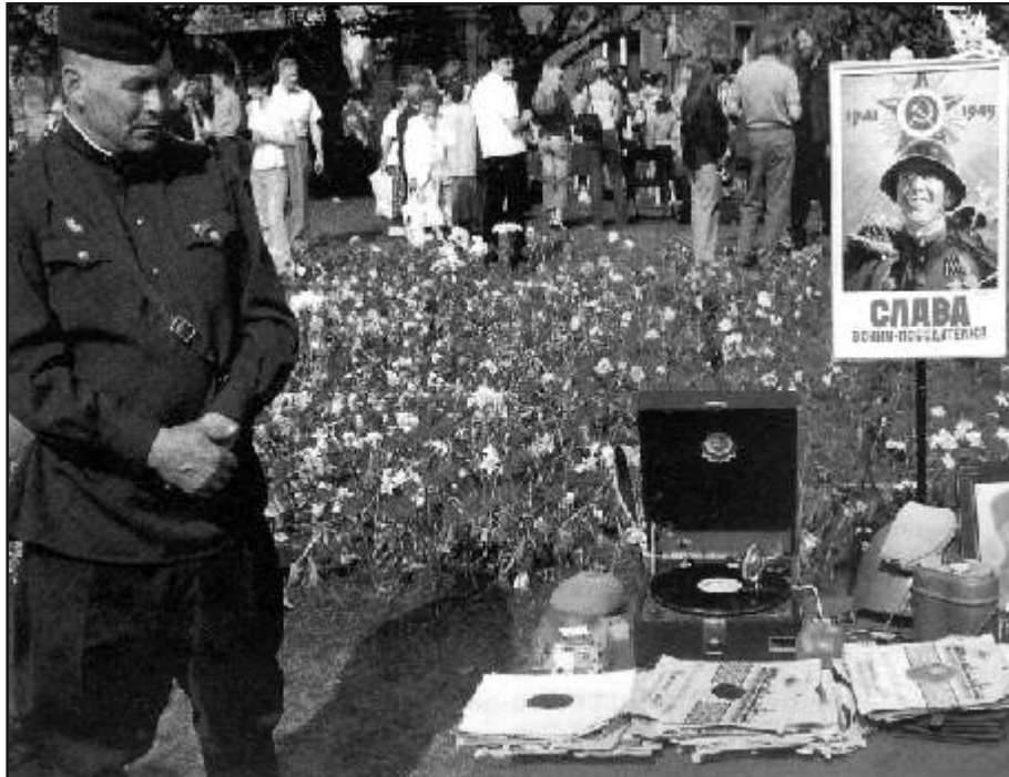
22. september tõi Pronksõduri juurde kokku nn "Tallinna vabastajad". Meenutades sealsamas tehtud Venemaa suursaadiku avaldusi, peaks olema selge, et meie ajalugu on asunud suunama uued jõud.