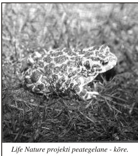
Life Nature projekti peategelane - kõre.