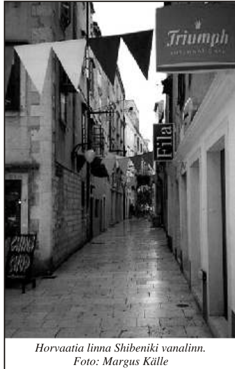
Horvaatia linna Šibeniki vanalinn.

Splitis ootas ees Rooma keisri Diocletianuse palee. Keiser oli ilmakärest tüdinud ja tahtis vaikust ning rahu. Pales ruumi jätkus, hiljem ehitati selle sisse väike linn, nüüdse Spliti linna süda. Horvaatia ajalugu on mitmekihiline. Oma