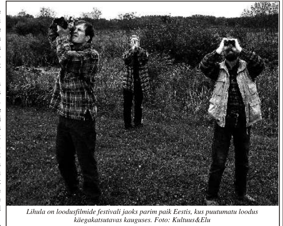
Lihula on loodusfilmide festivali jaoks parim paik Eestis, kus puutumatu loodus käegakatsutavas kauguses.

Festivali avamisel näidati saalisolijaile