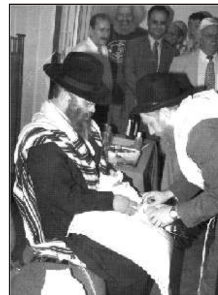
4. augustil toimus Tallinna sünagoogis judaistide püha üritus. Ümber lõigati rabi S.Koti vastündinud poeg. Üritusel osalesid ka mitmed välismaa diplomaadid.