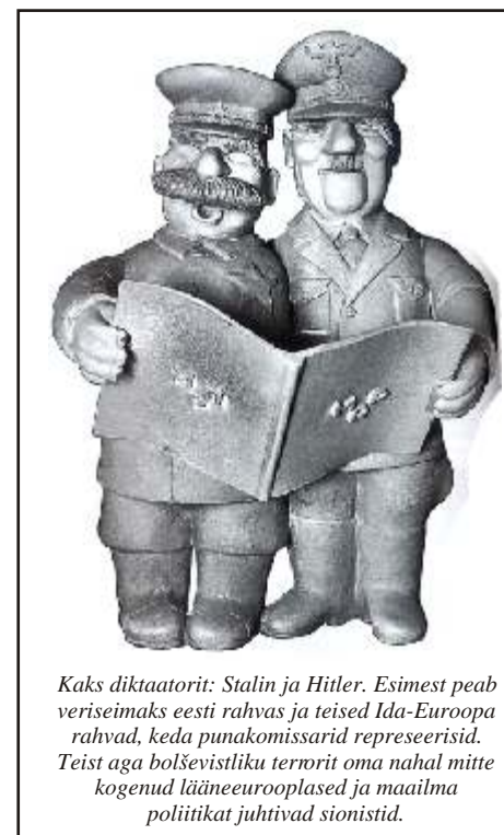
Kaks diktaatorit: Stalin ja Hitler. Esimest peab veriseimaks eesti rahvas ja teised Ida-Euroopa rahvad, keda punakomissarid represeerisid. Teist aga bolševistliku terrorit oma nahal mitte kogenud lääneeurooplased ja maailma poliitikat juhtivad sionistid.

Miks puudus tähtselt sündmuselt juutide "soovitusi" vastuvaidlemist mittelubavateks käskudeks pidav peaminister, seda artiklist ei selgu.